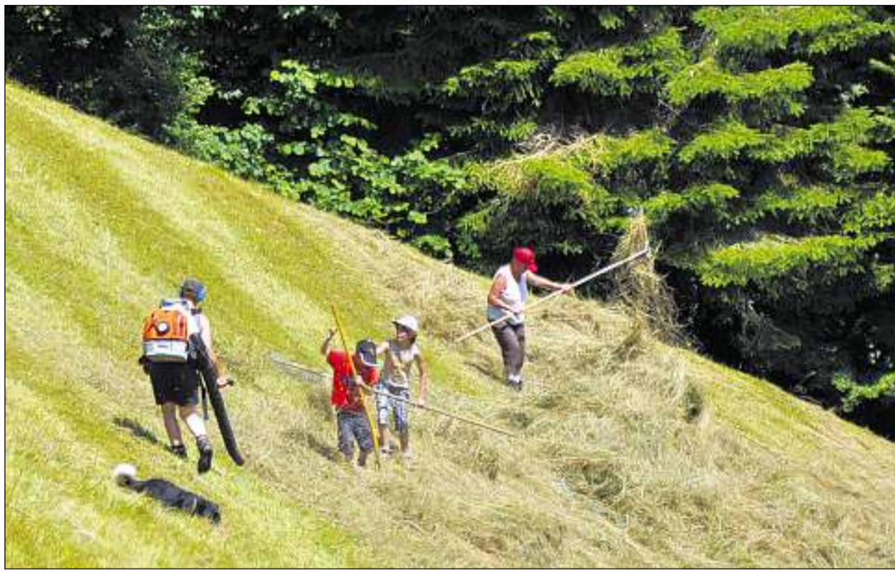
Concentraziun e «desertificaziun» furman duas problematicas constantas en il svilup demografic dal territori alpin.

La populaziun grischuna è s'augmentada tranter il 1850 ed il 1888 annualmain per 1,5 %, vul dir da 89 895 sin 94 810 persunas. La flaiyla digren da la populaziun da 30 a 25 % e la mortalità pli bassa ch'en l'ulteriura Svizra han effectua in aut surpli da naschientschas. En l'emprima mesadad dal 19avel tschientaner è stada la creschientscha demografica probablmain in pau pli auta. Il princip da l'autarchia, dretgs d'ierta variabls tenor regiuns, la vegliadetgna da maridar elevada e l'obligaziun a l'endogamia è restads facturs decisivs e caracteristics per il chantun Grischun agrar fin viaden il 20avel tschientaner. Il servetsch mercenar ha mantegnì sia impurtanza fin en ils onns 1840. Alternativas eran il «ir giu'l Schuob», pratitgà tranter il 1817 ed il 1850 da ca. 700 uffants e giuvenils l'onn (Schuobacheclers), sco era autras activitads artisanalas a l'exteriur (oravant tut pastiziers e cafetiers). Ins emigrava per regla cun l'intenziun da turnar pli tard en patria. En consequenza